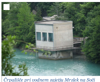
Črpališče pri vodnem zajetju Mrzlek na Soči